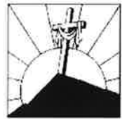
Qu'il repose en paix Qu'ils reposent en paix

Pour St-Fortunat(9 h) : dimanche 20 novembre avec ses 6 défunts